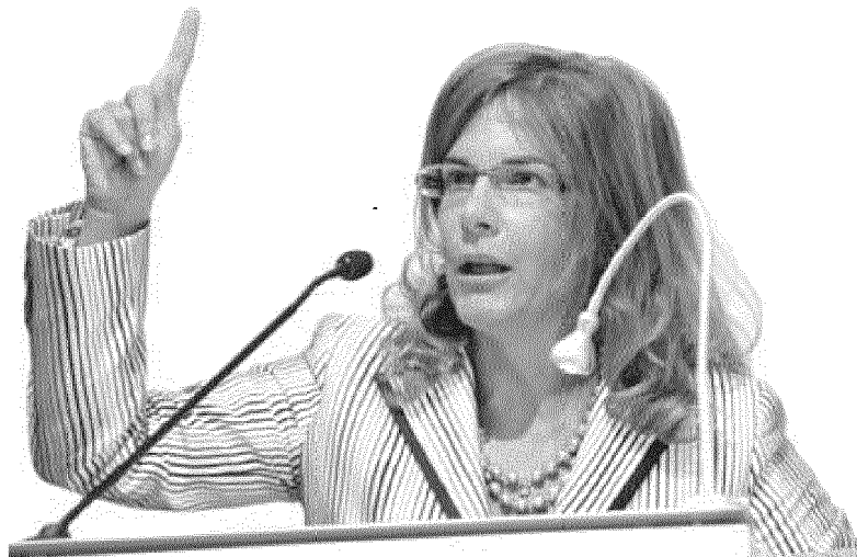
La presidente di Confindustria, Emma Marcegaglia